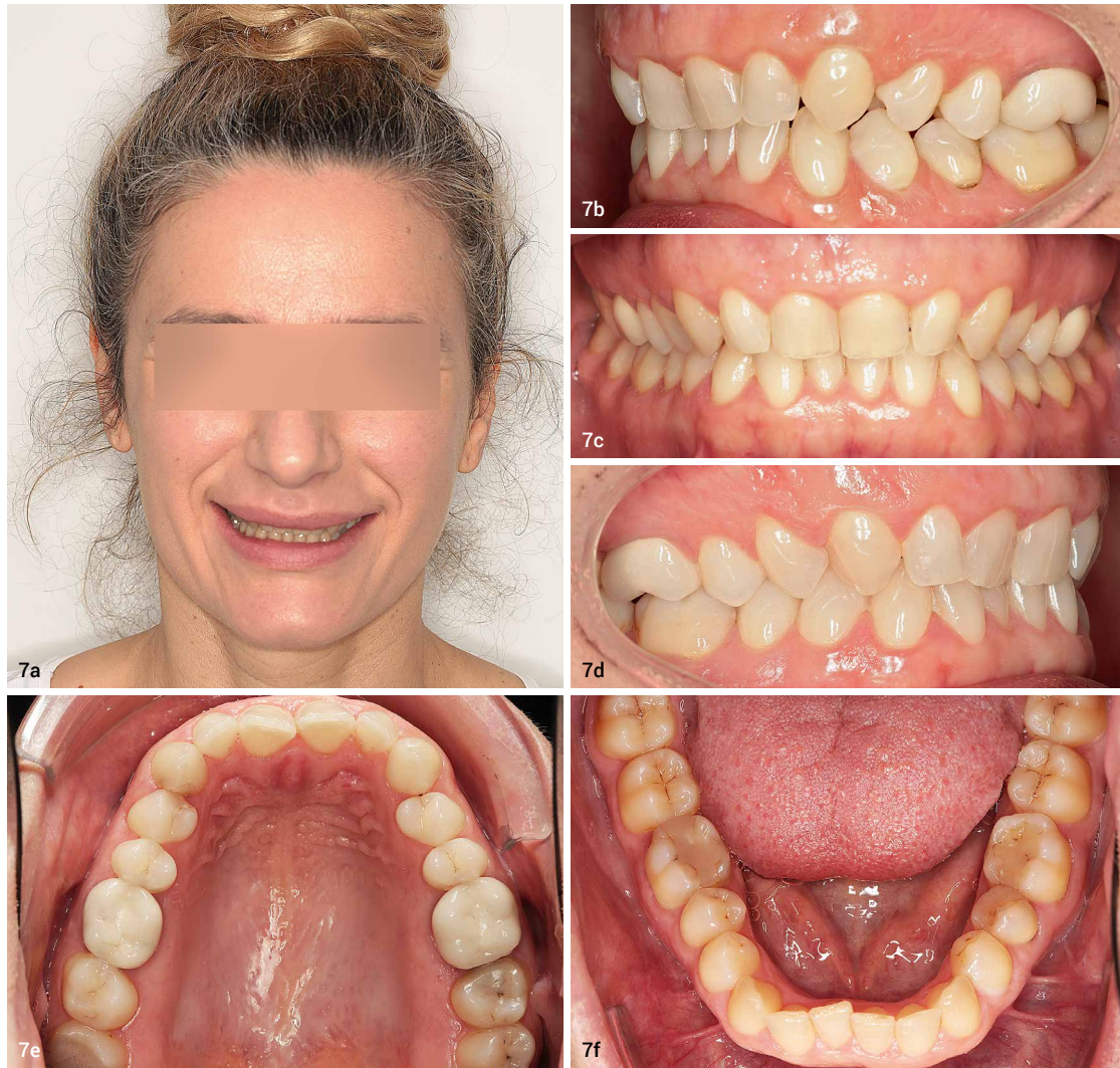
Abb. 7a-f: Klinische Ausgangssituation: Tiefbiss, Deckbiss, beim Lachen wenig Oberkieferfront sichtbar durch Überlappung der Oberlippe über der Front. Abb. 8a-e: Bebänderung XXXXXXXX Abb. 9: XXXXXXXX Abb. 10a-e: Behandlungsfortschritt XXXXXXXX. Abb. 11a-e: Zwischenbefund, gute Bisshebung und Lückenöffnung in der Oberkieferfront für die geplante Kronenversorgung zur ästhetischen Zahnvergrößerung.

entweder durch bukkale oder linguale Brackets oder mit sämtlichen Alignersystemen durchgeführt werden. In den meisten Fällen handelt es sich lediglich um die kieferorthopädisch durchzuführende Auffächerung der Front durch eine Proklination der oberen Inzisivi bei gleichzeitiger Verankerung der Seitenzähne. Oft beträgt die Behandlungsdauer je nach Ausgangssituation nur wenige Monate, sodass die Patienten weder durch zu hohe Kosten noch durch zu lange Behandlungszeiten belastet werden. Auf eine Unterkieferbehandlung kann zur Kostenersparnis für den Patienten bei einer guten Ausgangsbisslage in der Regel verzichtet werden. Bei den Behandlungen mit bukkalen oder ligualen Bracketsystemen empfiehlt es sich, mit sogenannten Stoppbögen zu arbeiten. Das bedeutet, dass mesial der Zähne 16 und 26 jeweils ein Stopp auf den Rundbogen aufgekrümmt wird, sodass die Frontzähne unter Ausnutzung der Gegenkraft an den Molaren nach anterior geneigt und aufgefächert werden können. Der Utility-Effekt macht eine zügige Proklination der OK-Frontzähne schnell sichtbar. Eventuell vorhandene Kopfbissstellungen und Störkontakte mit der Unterkieferfront können durch die kieferorthopädische Behandlung gleichzeitig beseitigt werden. Neben dem ästhetischen Effekt tritt somit auch eine Verbesserung der funktionellen Aspekte in Bezug auf die Kiefergelenke ein.